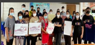
กิจกรรมยกระดับผลิตภัณฑ์ การตลาด และการบริหารจัดการกลุ่มอาชีพในชุมชน