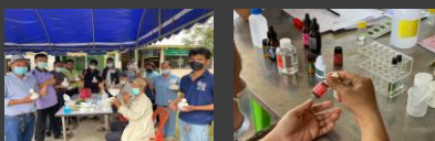
กิจกรรมเพิ่มผลิตภาพทางการเกษตรของชุมชนตำบลชุมภูพร