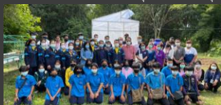
กิจกรรมส่งเสริมการปลูกผักปลอดภัยเพื่อสุขภาพ และสร้างอาชีพเสริมในชุมชน