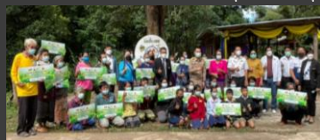
กิจกรรมการตลาดสร้างแบรนด์ผลิตภัณฑ์ด้วยเทคโนโลยีดิจิทัล